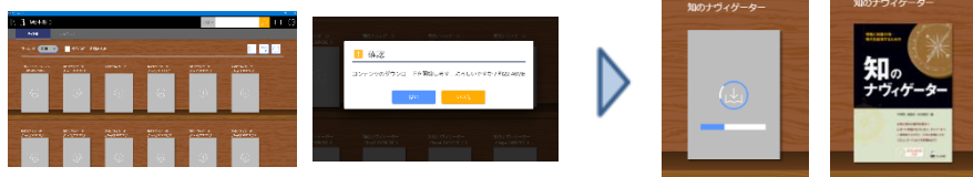
本棚が表示され、グレーの表紙画像をタップ (クリック) しダウンロード開始